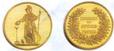
Guldmedalje magen til J. P. Jacobsens.